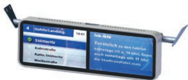
ID-18-T-R / MD-18-T-R 18,5 Zoll Twin Display für Businstallation Adaptierung an das Fahrzeug über Haltestange