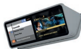
ID-18-Q-R / MD-18-Q-R 18,5 Zoll Quad Display für Straßenbahnen Adaptierung an das Fahrzeug über Montagekeil

ID=Displays für GigaStar Übertragung mit MS-700