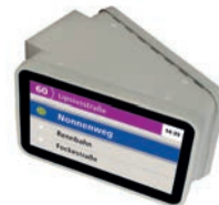
ID-18-S-W / MD-18-S-W 18,5 Zoll Back-to-Back Display für Seitenmontage in Fahrzeuge mit geringer Durchgangshöhe