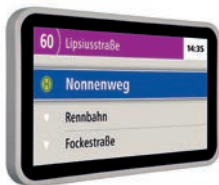
ID-18-S-U / MD-18-S-U 18,5 Zoll Single Display für Entry Level Fahrgastinformation