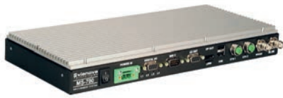
MS-700 Fahrzeugserver mit GigaStar Gen. 3 (bis 3 GBit/s) Videoausgängen. Passiv gekühlt.

VIANOVA Technologies bietet mit modularen On Board Komponenten und der flexiblen bitcontrol® LISA Softwareplattform schlüsselfertige Infotainmentsysteme für Bus und Bahn – Wahlweise mit abgesetztem Server oder mit intelligenten Displayeinheiten – Für alle Einbausituationen in den gängigen Fahrzeugtypen.