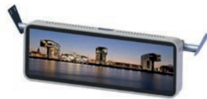
ID-29-S-R / MD-29-S-R 29 Zoll Singledisplay im 32:9 Format Verschiedene Montageoptionen verfügbar.